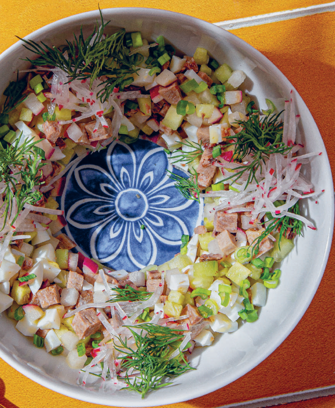
ОКРОШКА С ГОВЯЖЬИМ ЯЗЫКОМ