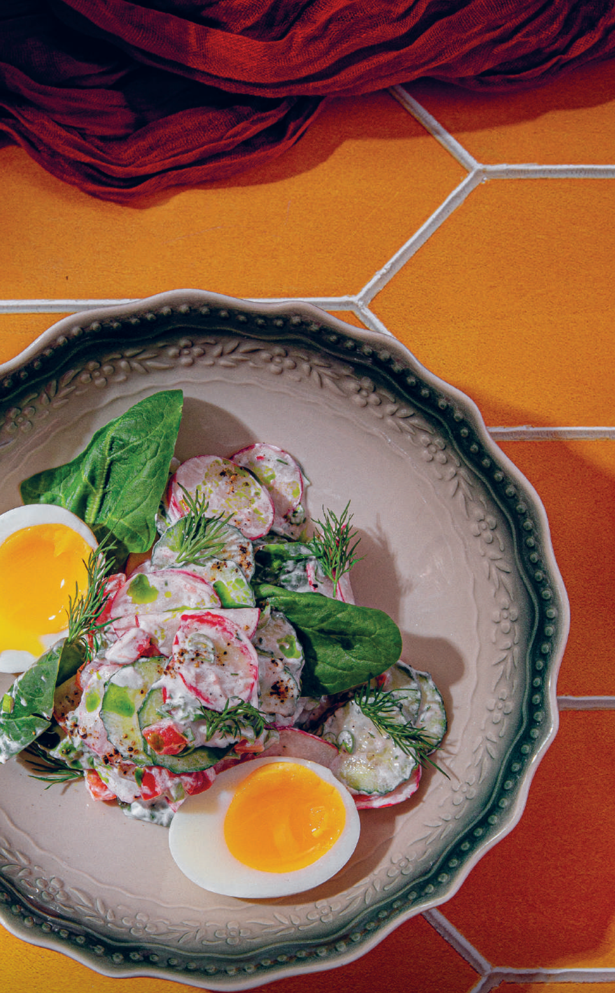
САЛАТ С РЕДИСОМ И ОГУРЦОМ