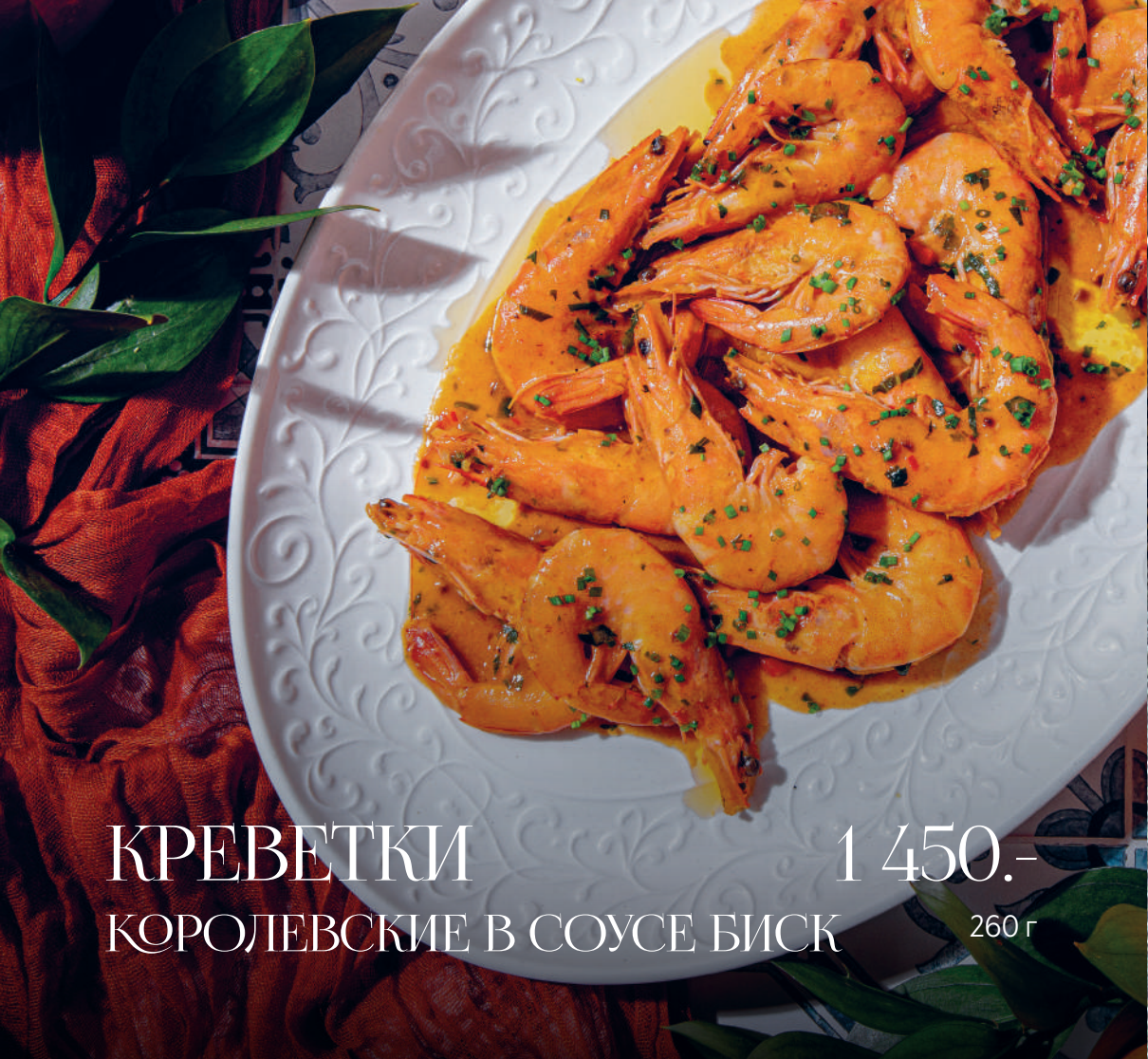
КРЕВЕТКИ КОРОЛЕВСКИЕ В СОУСЕ БИСК 1 450.- 260 г