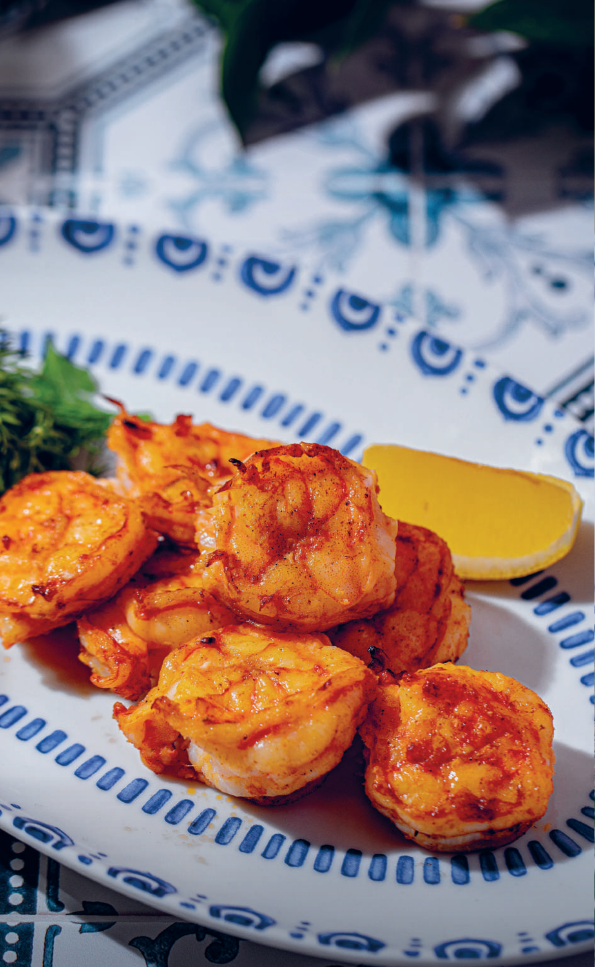
ШАШЛЫК ИЗ КРЕВЕТОК