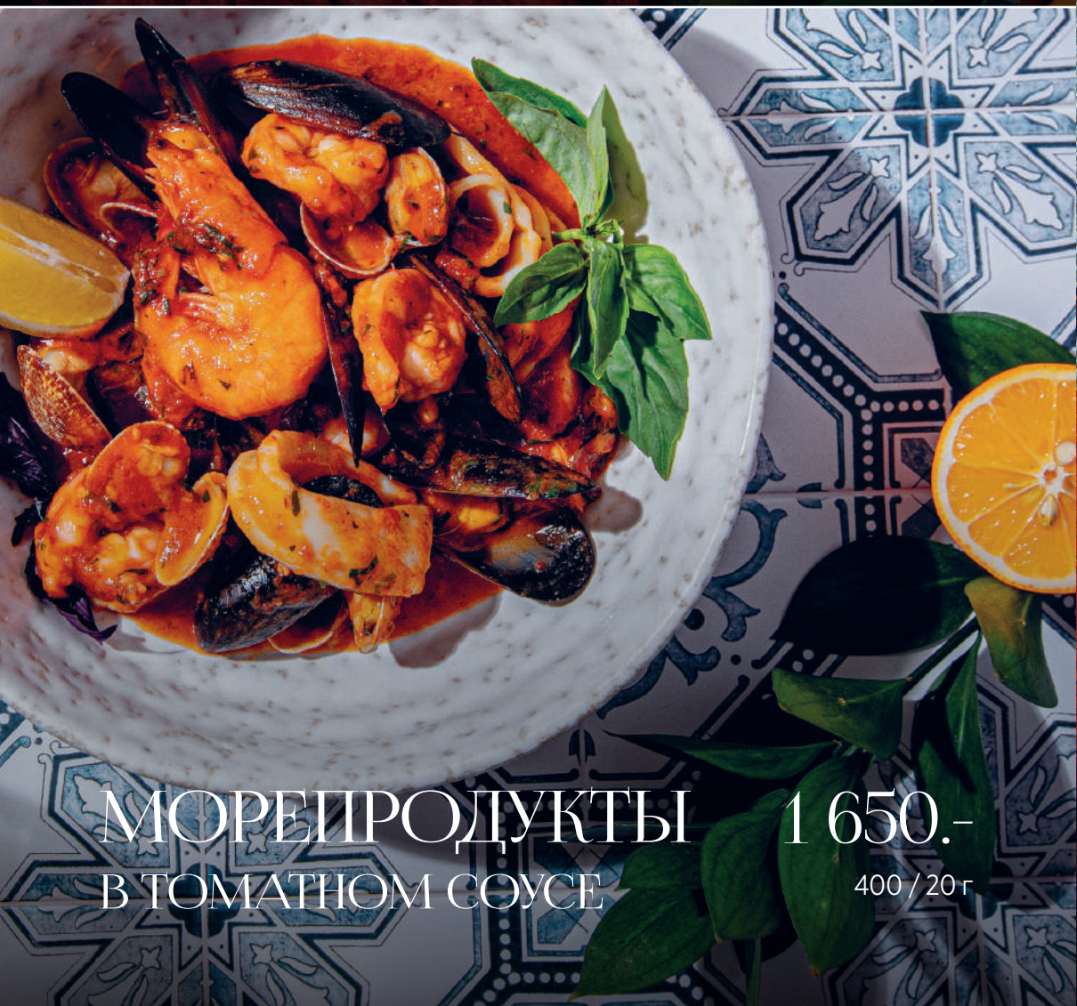
МОРЕПРОДУКТЫ В ТОМАТНОМ СОУСЕ 1 650.- 400 / 20 г