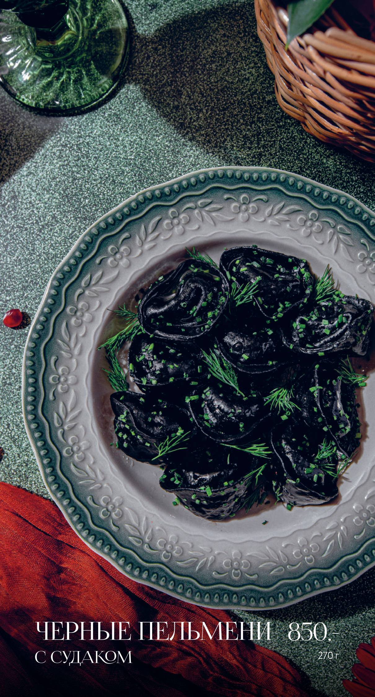
ЧЕРНЫЕ ПЕЛЬМЕНИ 850.- С СУДАКОМ 270 г