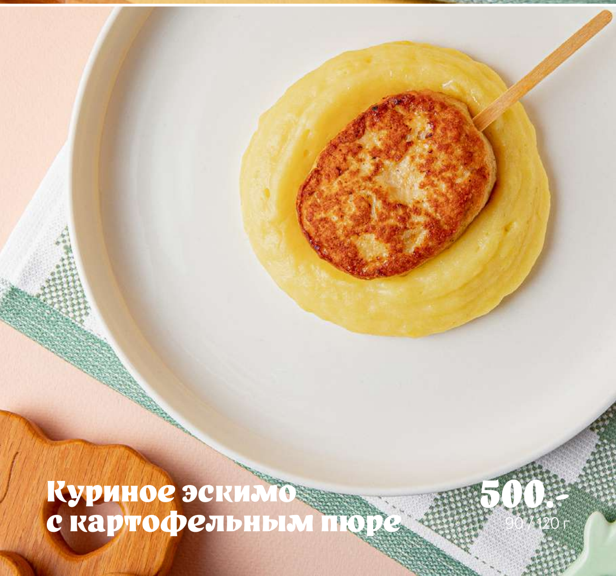
Куриное эскимо с картофельным пюре