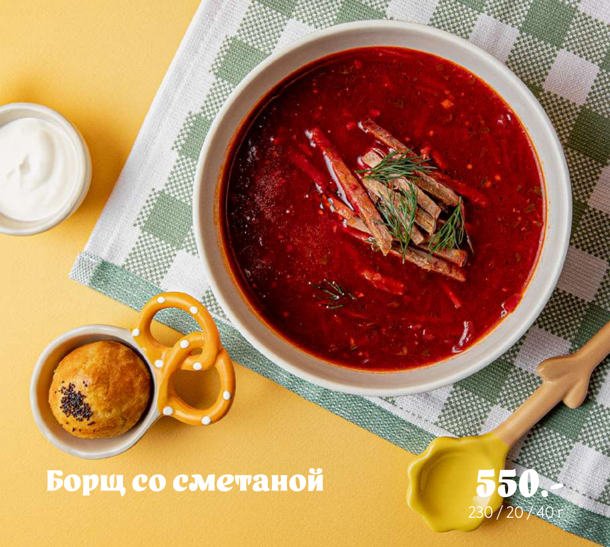
Борщ со сметаной