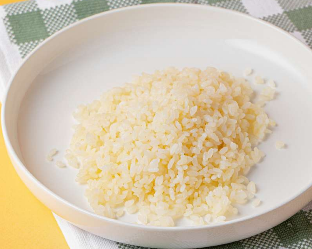
Рис на пару