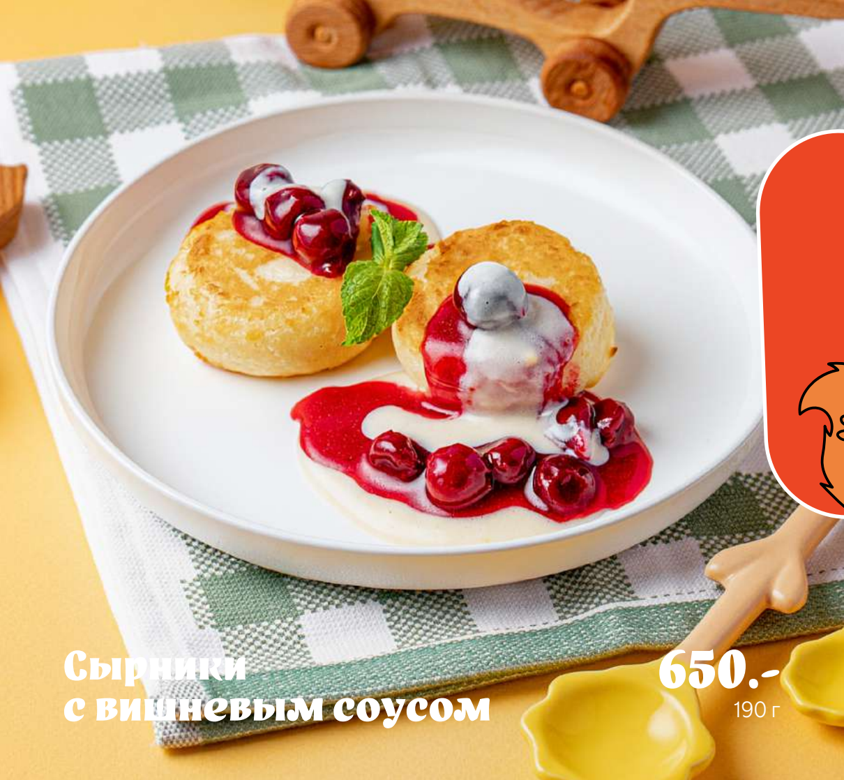
Сырники с вишневым соусом