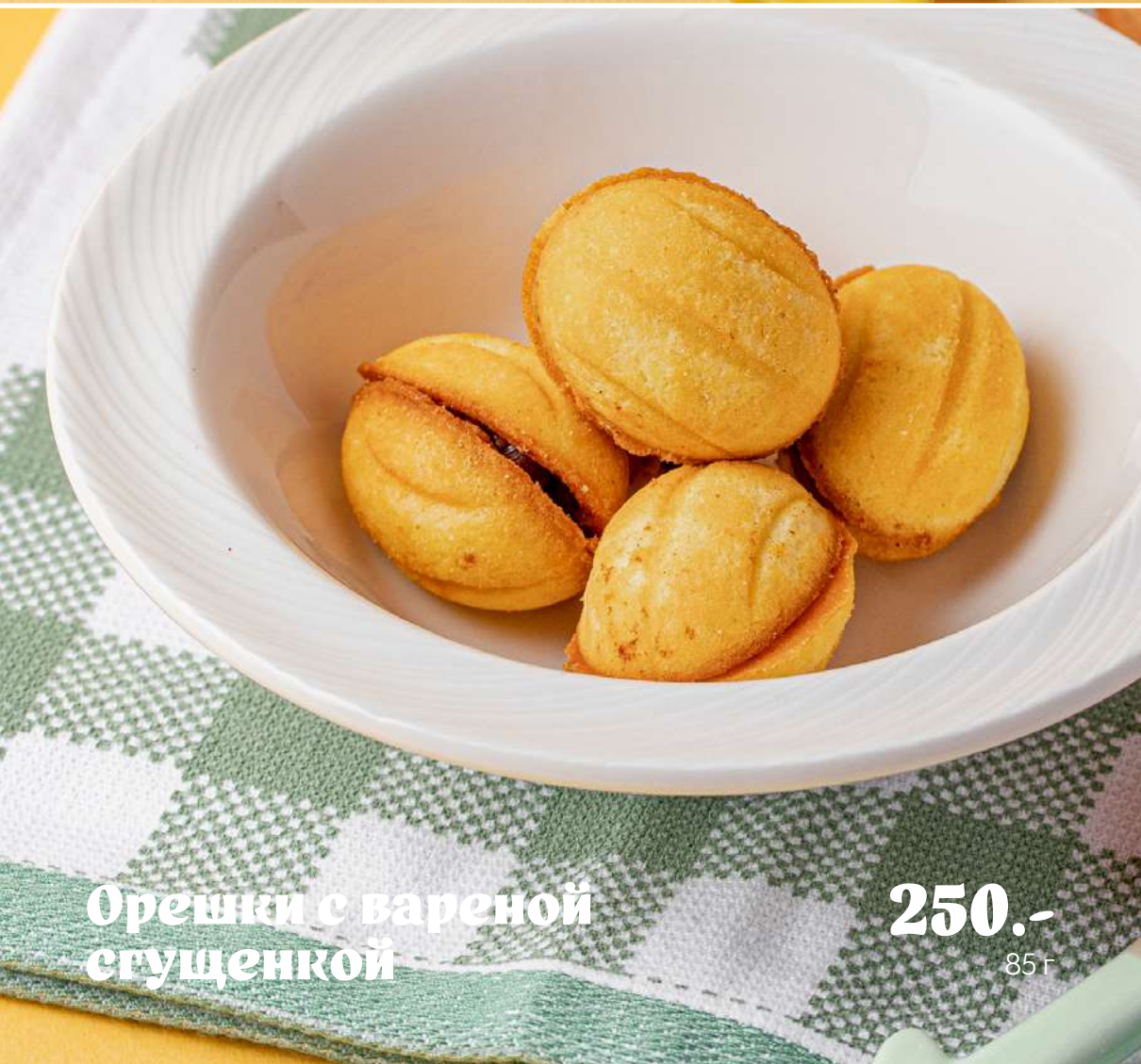
Орешки с вареной сгущенкой