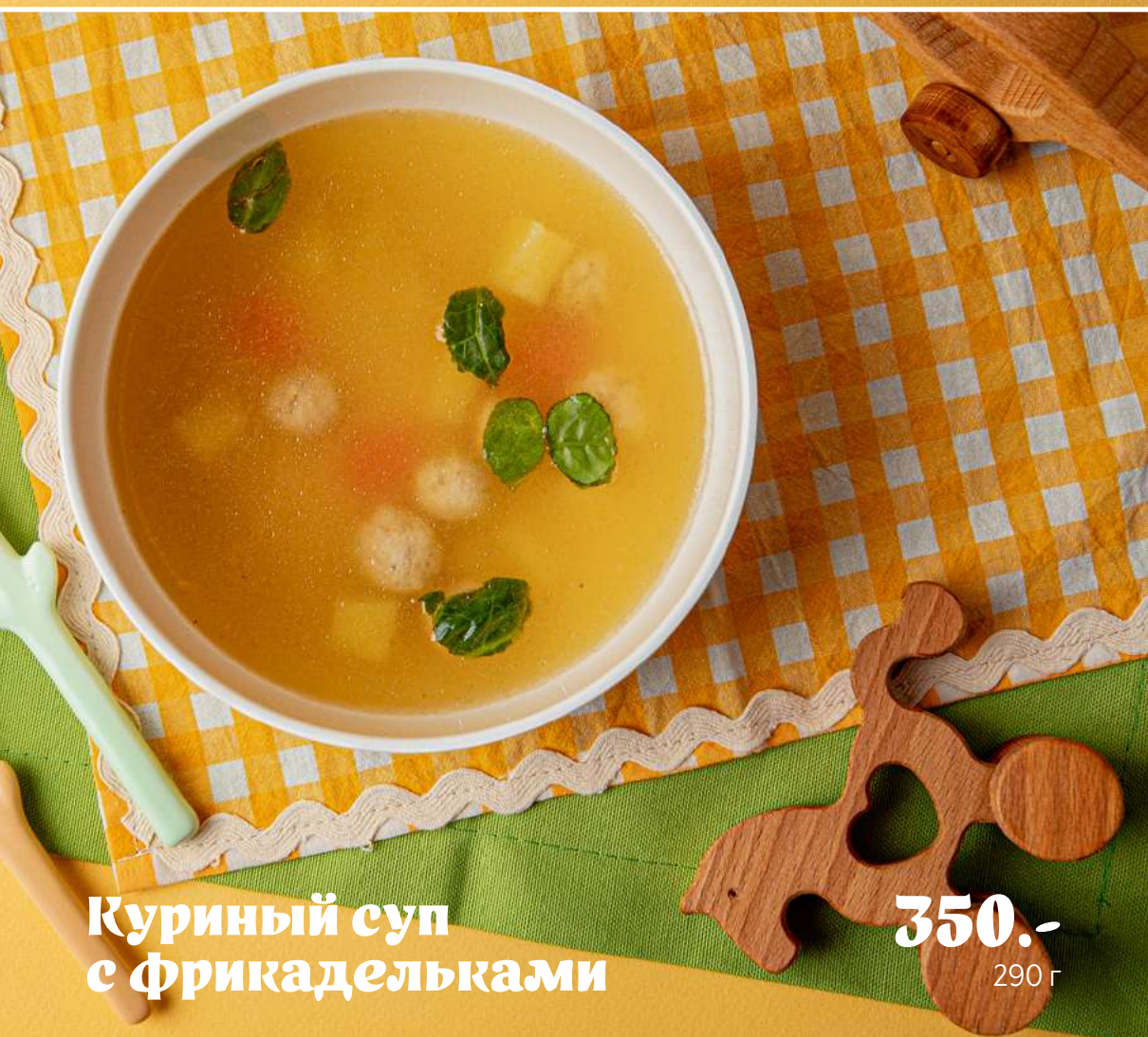
Куриный суп с Фрикадельками